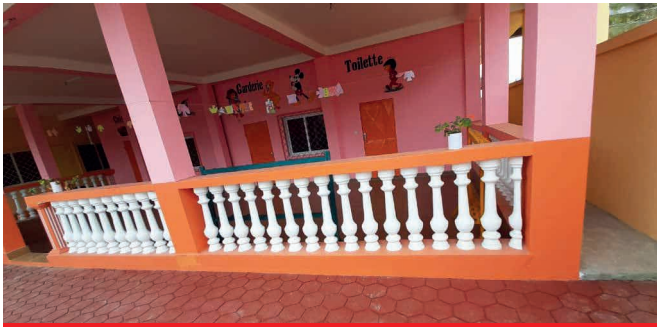
Il piano terra del costruendo College... con i colori della generosità dei benefattori