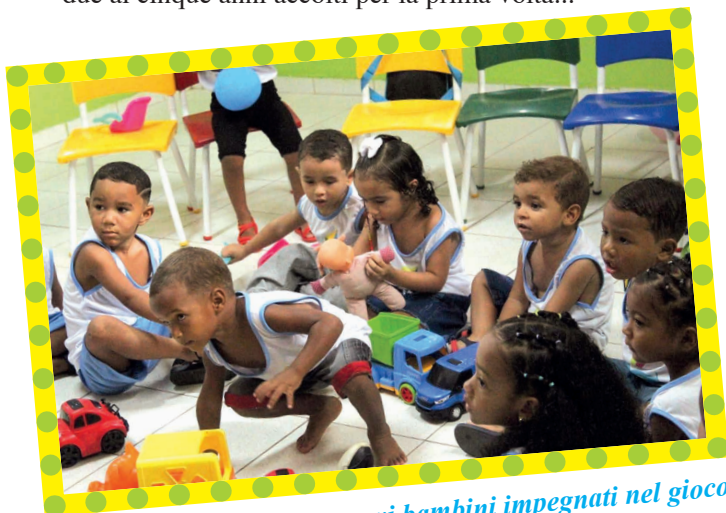
Primo giorno di scuola, nuovi bambini impegnati nel gioco