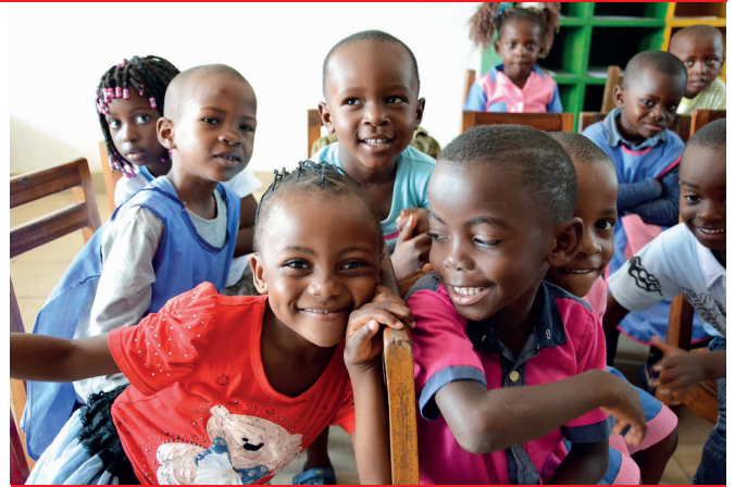
Bambini felici sembrano dire "Grazie benefattori!"

di poter completare almeno i lavori edili entro l'anno per procedere poi all'allestimento delle aule anche in base agli aiuti che riceveranno dai benefattori.