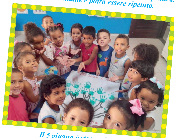
Il 5 giugno è stata celebrata la "Giornata Mondiale dell'Ambiente" ed i bambini sono stati condotti ad approfondire l'importanza della cura del Creato e la sua bellezza.