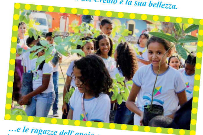
...e le ragazze dell'apolo a mettere a dimora nuove pianticelle... e quando negli anni passeranno per quel piccolo bosco potranno dire "questa è opera mia!"

...da queste immagini appare la vivacità tutta brasiliana, l'impegno e l'efficacia con cui il Centro Padre Enzo porta i bambini, le bambine, i ragazzi e le ragazze di Tamandarè, particolarmente della Favela, a formarsi come persone e cittadini.