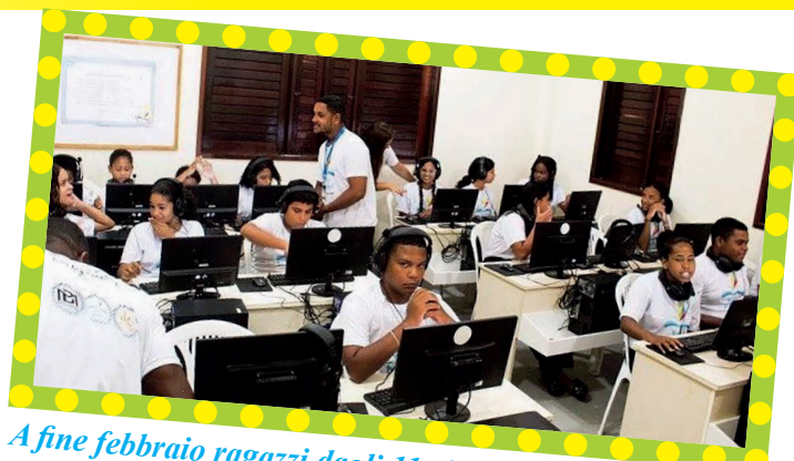
A fine febbraio ragazzi dagli 11 ai 17 anni hanno iniziato un corso approfondito di informatica teorica e pratica. Il corso è annuale e potrà essere ripetuto.