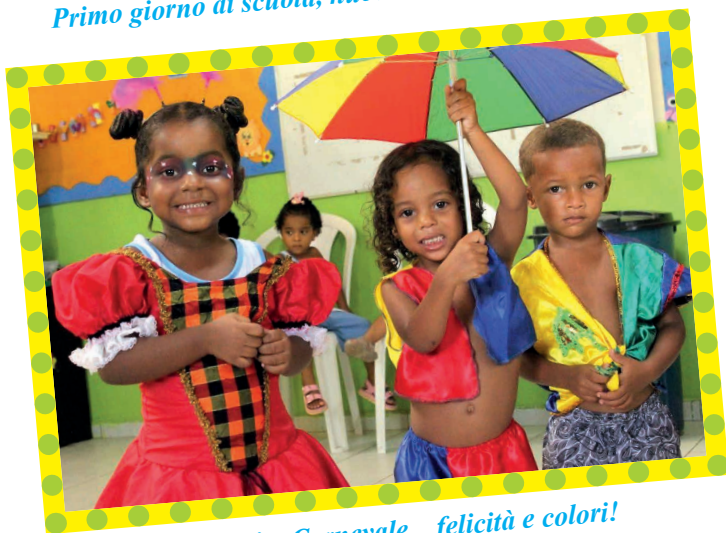
ed è subito Carnevale... felicità e colori!